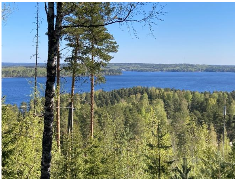
Utsikt över Päijänne från Aurinkovuori