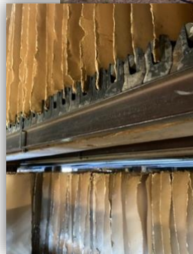
Forsen i Verla

Efter rundturen fortsatte utflykten tillbaka till Åggelby.