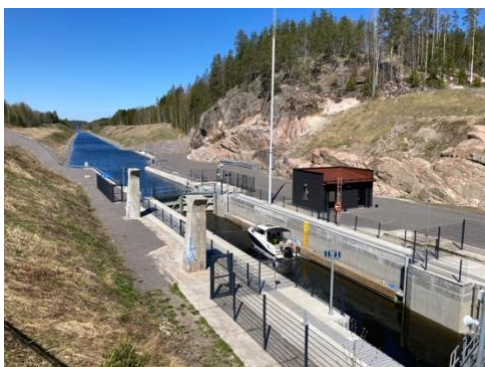
Slussning på gång i Kimola kanal

Efter besöket vid Aurinkovuori fortsatte resan mot Verla via Jenkkapirtti i Vesivehmaa, Kimola kanal och Vierumäki.