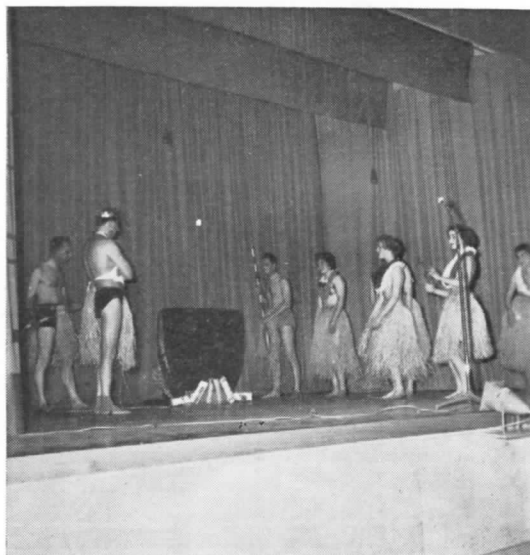
En scen ur det lyckade programmet på Svensk Förenings 50-årsfest.

gick i en nästan o-finländsk takt. Att allt blev färdigt bara två månader försent, bevisar ju redan detta.