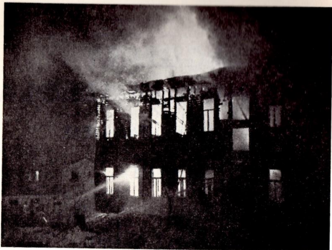
Elden är lös!