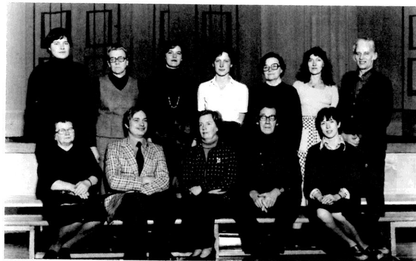
Äggelby svenska samskolas lärare och personal 1976—77.